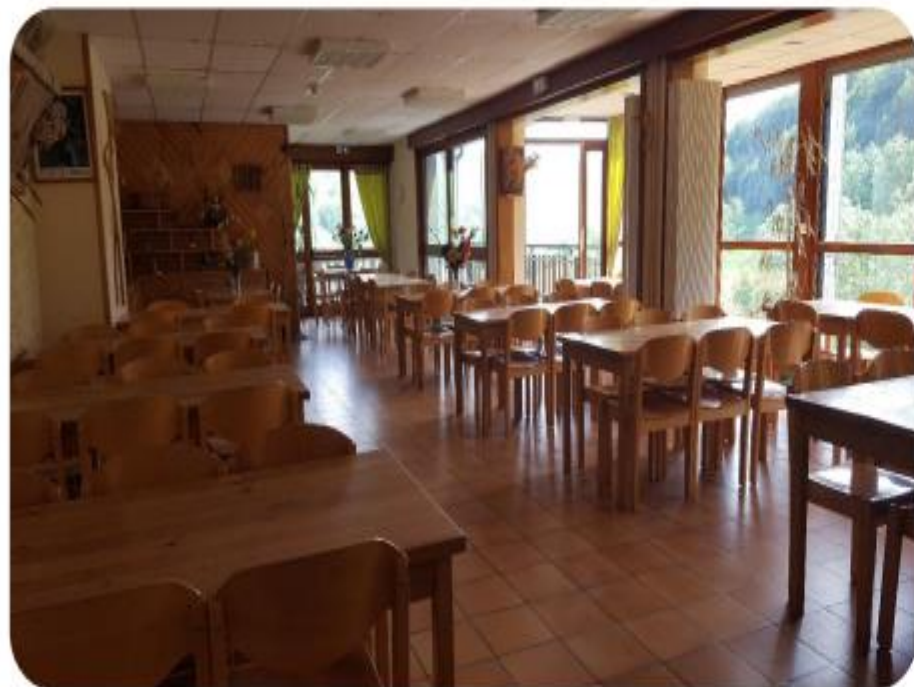
La salle à manger