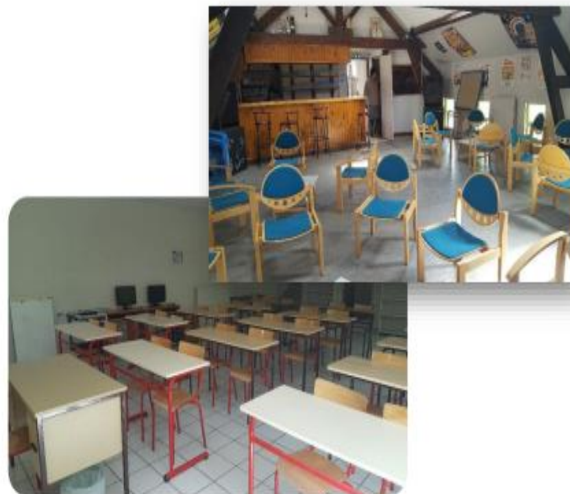
L'une des salles de classe et l'une des salles polyvalentes