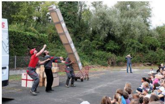
Les livreurs déjantés de la Compagnie Cirque en scène dans "Oups, la livraison d'enfer" Jean-Louis Le Bras

Par Jean-Louis LE BRAS, publié le 1 octobre 2019 à 17h19, modifié à 20h00.