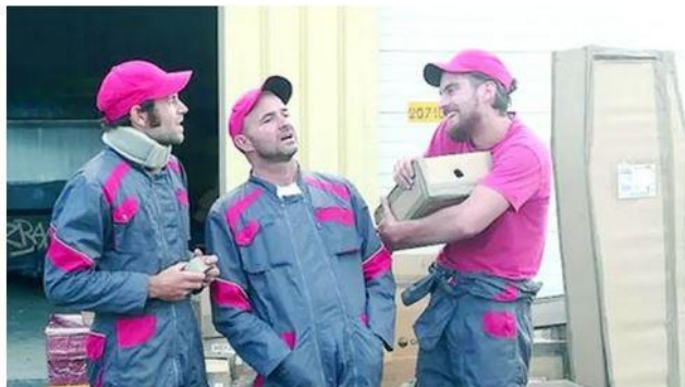
Théâtre, musique, danse et feu au programme de la clôture du Festival de l'Agglo à Praheçq ce vendredi.

CIRQUE EN SCÈNE - Centre des Arts du Cirque de Niort