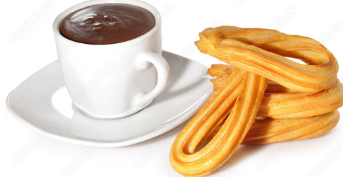
el chocolate con churros