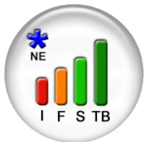
Code couleur sur PRONOTE