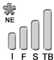
Evaluation de suivi