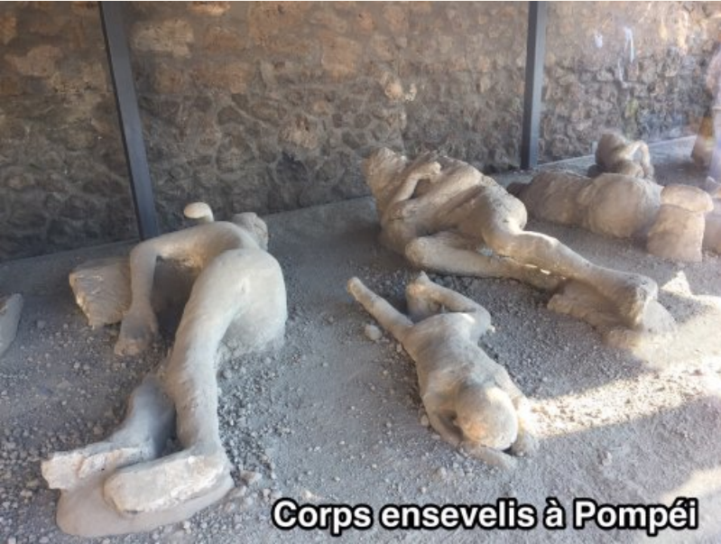
Corps ensevelis à Pompéi