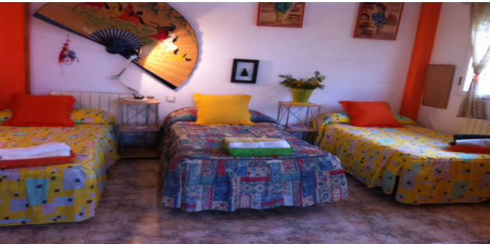
Appartement des professeurs