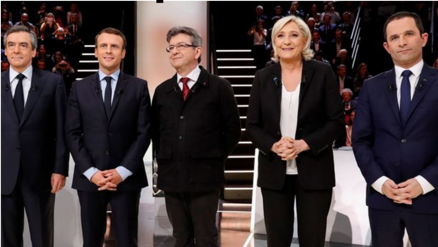
Le premier débat télévisé entre les principaux candidats à la présidentielle François Fillon, Emmanuel macron, Jean- Luc Mélenchon, Marine Le Pen, benoît Hamon le 20 mars a Aubervilliers

Un bilan plutôt calme pour ce premier débat télévisé réunissant les principaux candidats à la présidentielle de 2017.