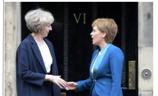
Photo prise le 15 juillet 2016 qui montre la première ministre britannique, Theresa May, saluée par la première ministre écossaise, Nicola Sturgeon, alors qu'elle arrive pour des entretiens à Bute House, à Edimbourg.

En route vers une nouvelle Écosse européenne ? p.2