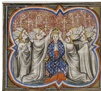
Enluminure anonyme extraite des Grandes Chroniques de France , XIVe siècle. Paris, Bibliothèque nationale de France

Cette séquence d'Histoire est la troisième (et la dernière) du thème 2 sur l'Occident Médiéval. Reprenant le chapitre 1 sur la place centrale des seigneurs dans la société de l'époque, le but est de découvrir la hiérarchie des pouvoirs qui s'est construite entre eux, ne laissant en pratique que peu de pouvoir au roi de France. Le Moyen-Age va donc être pour les rois successifs une longue période de "lutte" pour consolider, renforcer ou développer leur autorité réelle sur l'ensemble du royaume "des Francs" qui devient peu à peu le royaume "de France"