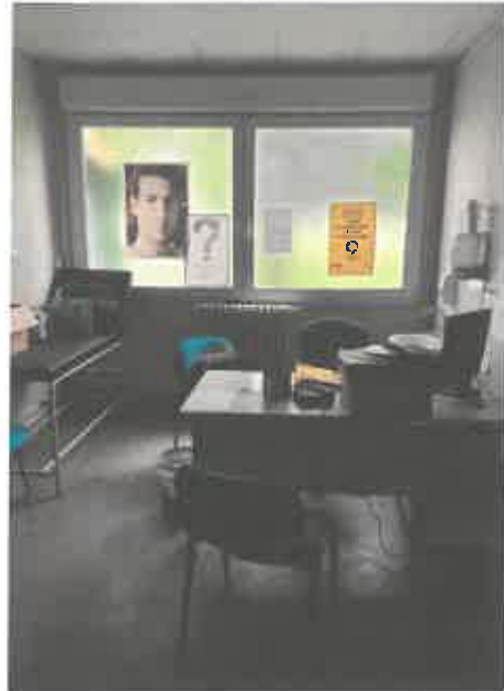
INFIRMERIE DE LEZAY