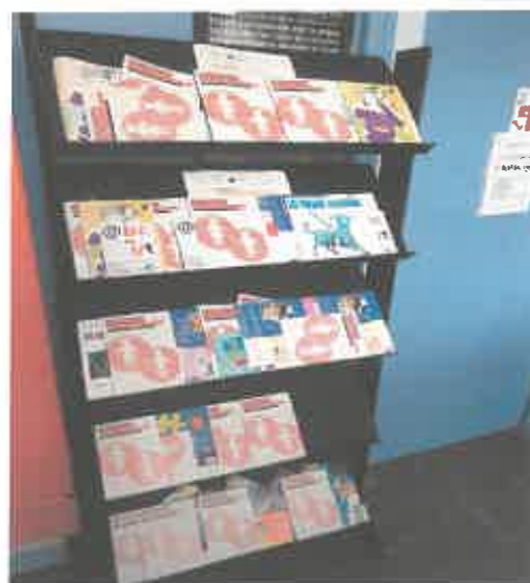
Portant de Lezay