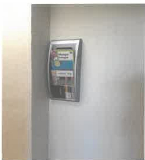
Portant de Sauzé-Vaussais

A Sauzé-Vaussais, le portant se trouve devant la porte de l'infirmerie, et à Lezay, il se situe dans la salle d'attente qui jouxte l'infirmerie. Je renouvelle assez régulièrement les différents prospectus et flyers.