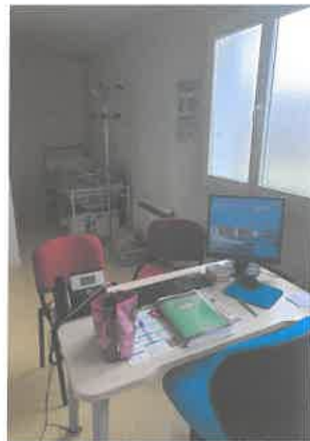
INFIRMERIE DE SAUZE-VAUSSAIS