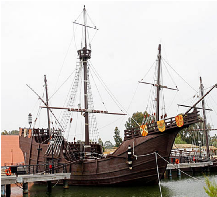
La replica della Santa Maria costruita a Columbus ed è ormeggiata sul fiume Scioto.

Pare che i suoi marinai la chiamassero Marigalante . Bartolomeo de Las Casas non usò mai i nomi La Gallega , Marigalante o Santa María nei suoi scritti, indicandola come la Capitana o La Nao (la nave).