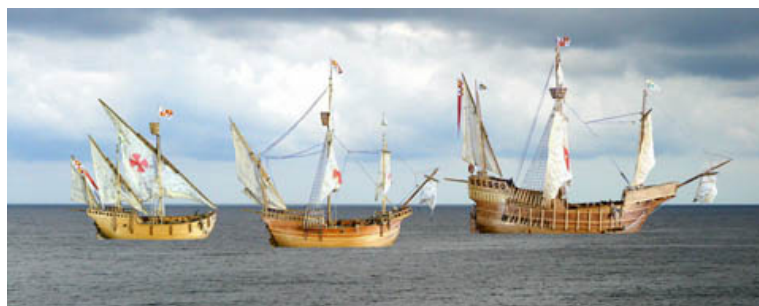
La flotta di Cristoforo Colombo

La Santa María era una caracca (nonostante comunemente venga ritenuta una caravella come le sue due compagne) e venne usata come nave ammiraglia della spedizione.