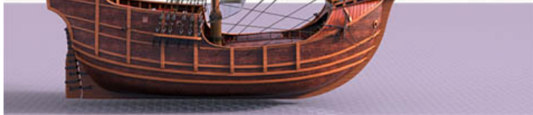
La Santa Maria di Cristoforo Colombo