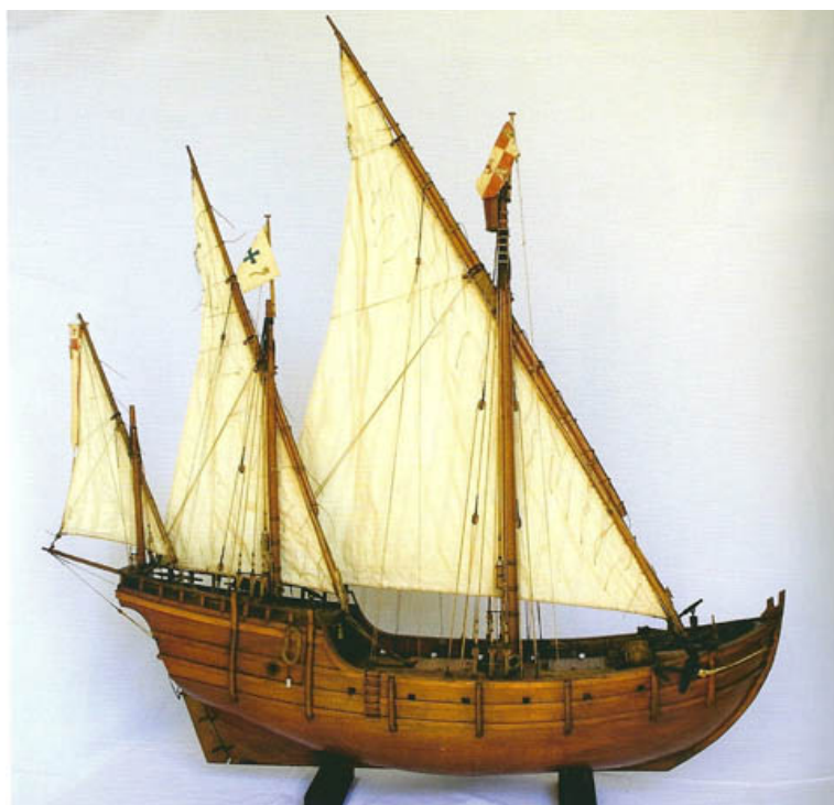
Riproduzione della Niña

La Niña (spagnolo: "piccola bambina") fu una delle tre navi utilizzate da Cristoforo Colombo nel suo primo viaggio attraverso l' Oceano Atlantico nel 1492.