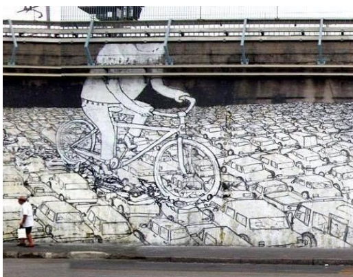
3. Blu, "Meglio in bicicletta", Milano