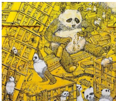
4. Blu, "Pandemia", Campobasso