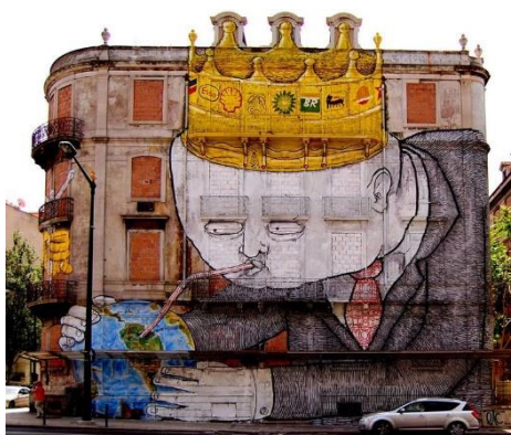
1. Blu, Lisbona

Blu: il famoso artista sconosciuto amante dei muri