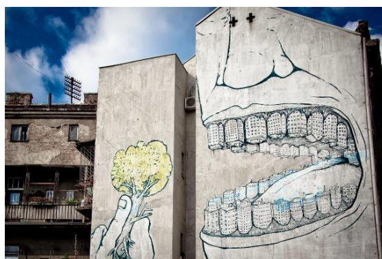
2. Blu, Belgrado