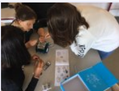
Assemblage des robots en équipe

Découverte des robots ozobots : Suiveurs de lignes et programmables