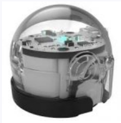
Petit et complexe