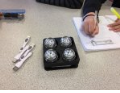
Conception d'un support pour ranger les robots