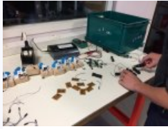
Réalisation de maquettes