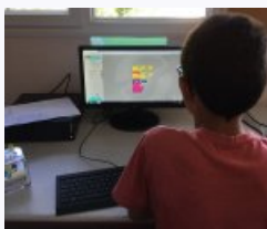
Programmation par blocs

Découverte des robots ozobots : Suiveurs de lignes et programmables