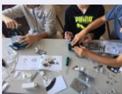
Un travail minutieux et rigoureux

Découverte des robots mblock : Suiveurs de lignes, programmables, munis de différents capteurs