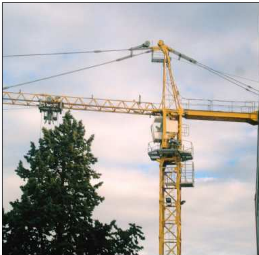
Travaux au collège.

Pour ce premier numéro : interview, reportages, collège, mode..