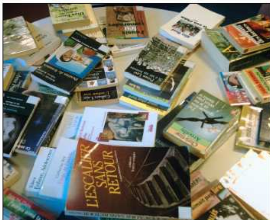
Le Centre d'information et de Documentation