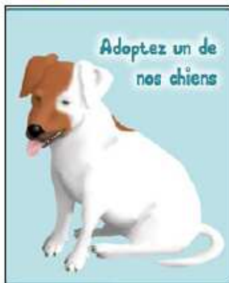
Une image de Dogivalley

Au début vous êtes au niveau 1, vous choisissez un chien entre un jack russel, un golden retriever, un carlin, un dogue argentin, un berger allemand, un dalmatien, un chihuahua et un beauceron. Quand vous aurez choisi un chien entre les 8 dont je vous ai parlé, ils vous expliqueront comment lui donner un nom. Quand on a un chien virtuel, il faut s'en occuper sinon il meurt ou s'enfuit. C'est pour cela qu'il y a une boutique où vous pourrez acheter avec vos wouggies (l'argent que l'on utilise dans le jeu), il y a de quoi manger pour votre chien, des jouets, de quoi le soigner et le laver. Il y a les