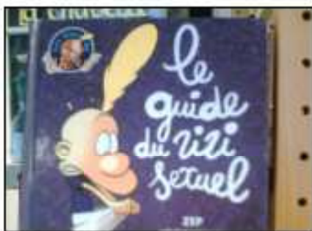
Le guide du zizi sexuel illustré par ZEP, le papa de Titeuf.

Bien sûr, tous ces livres vous sont prêtés au CDI, alors n'hésitez pas à venir les chercher !