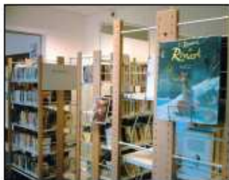
Les romans au C.D.I.