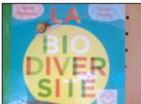
La Biodiversité, c'est la vie ! Sias-tu que l'année 2010 est l'année de la biodiversité ?