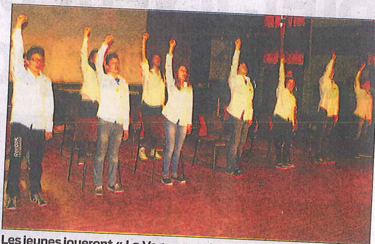
Les jeunes joueront « La Vague », qui traite du « pouvoir par la discipline », expérience qui rappelle les principes du nazisme.