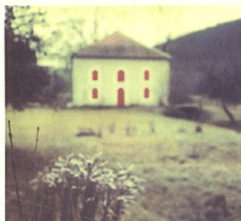
Moka Le petit cœur brisé Médium