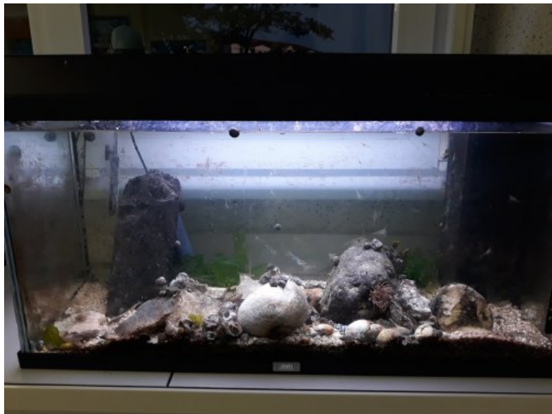
Une anémone prône sur son rocher