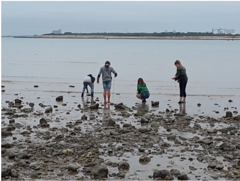
Prises des mesures