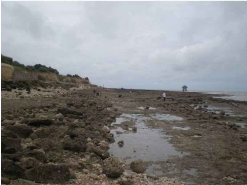
A chacun sa flaque