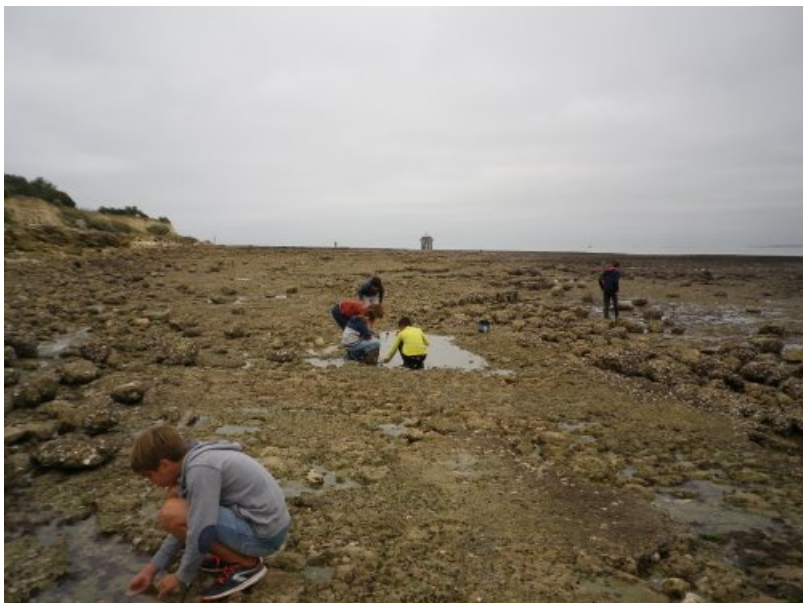
Des techniques de pêche efficaces à la main