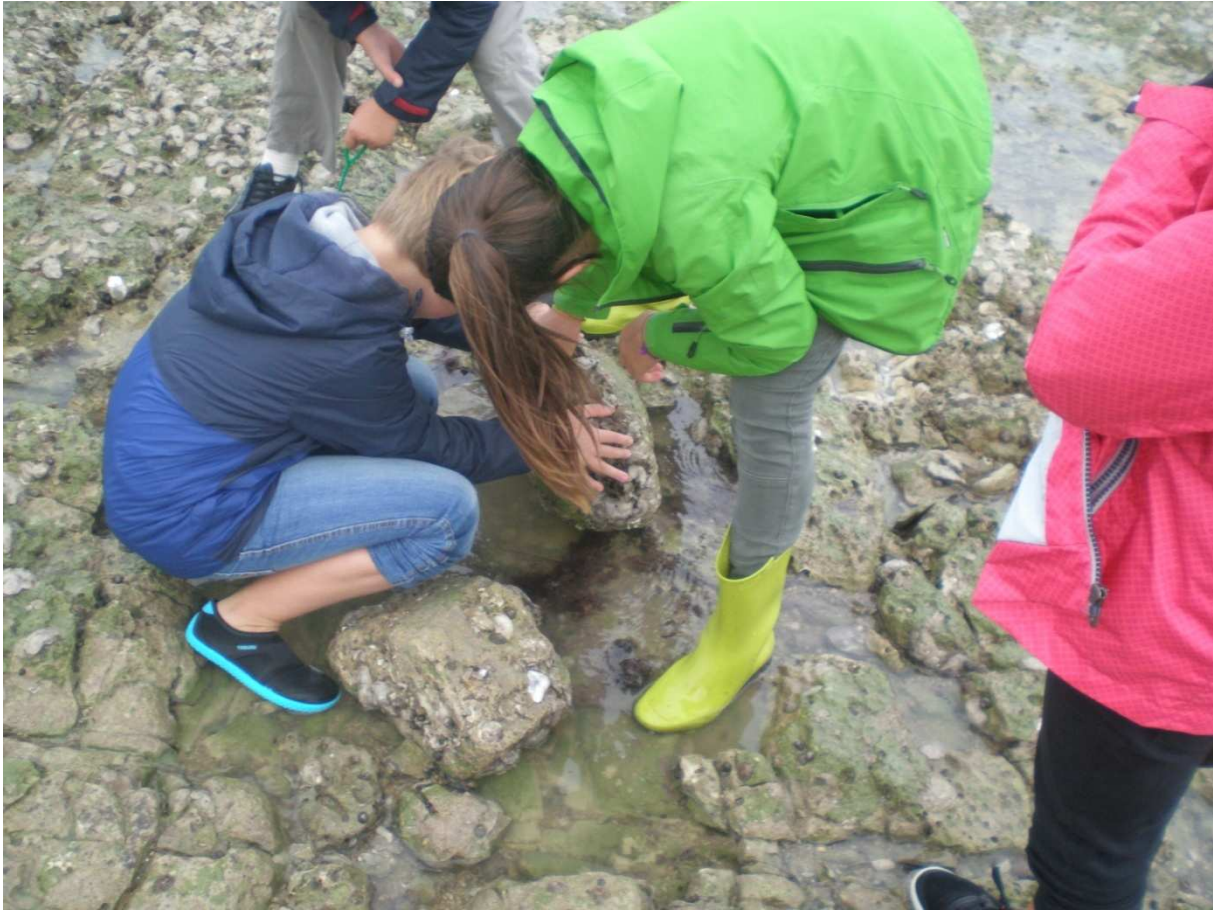
La vie est riche sous les rochers