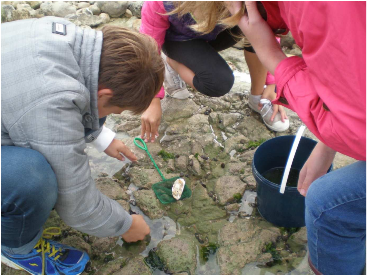
À la pêche au crabe...