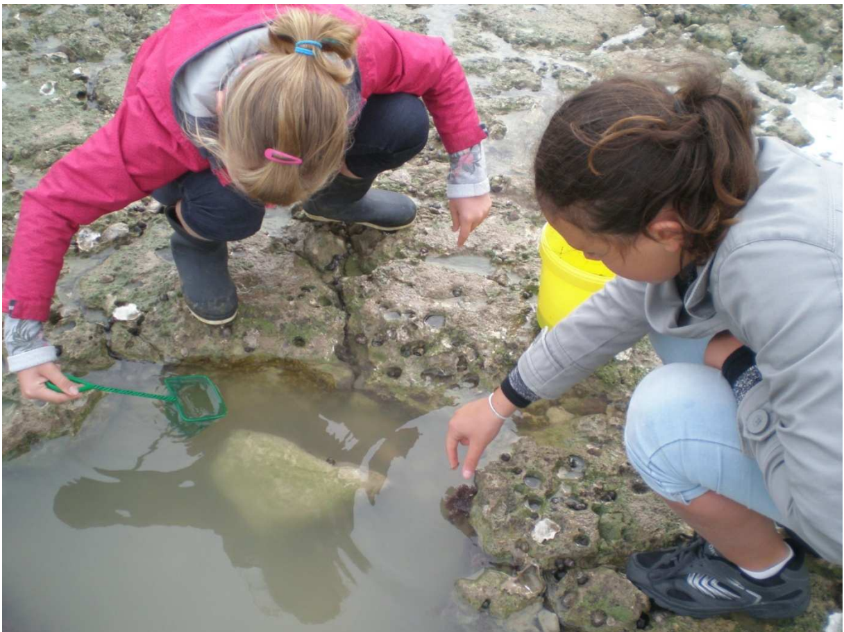
À la recherche de crevettes attirées par les appâts déposés dans notre épuiette