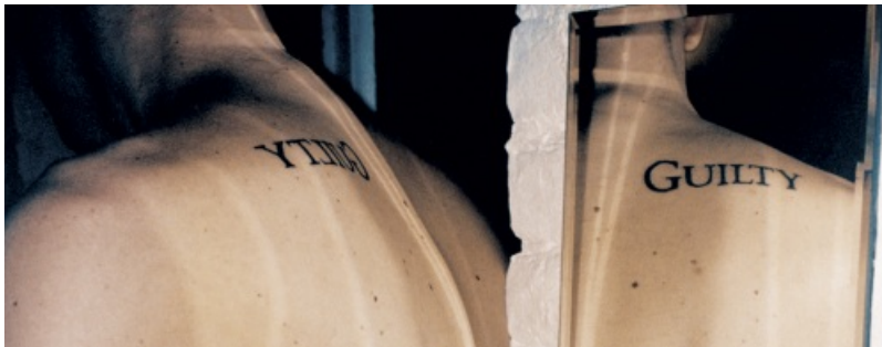
Douglas Gordon Tatoo 1997

La classe de 5E qui a été active et sympathique tout au long de l'année a joué le jeu lors de cette visite de l'exposition " Parlons-en " -thème Art et Langage- pour se transformer en guide-conférencier pour une œuvre. Par groupes de 4 ou 6 élèves ils ont préparé l'analyse d'une œuvre qu'ils avaient choisie pour la présenter ensuite à l'ensemble de la classe. Pari réussi ! Leurs analyses pertinentes ont intéressé un public attentif. La visite a été suivie d'un atelier.