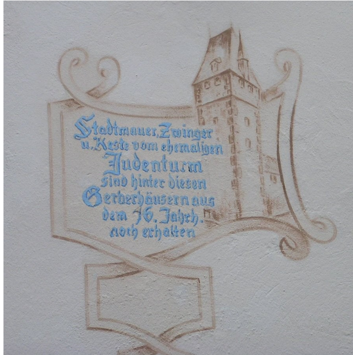
Vestige de la "Judenturm" à Weinheim

avec les tanneurs, ils étaient d'excellents commerçants et artisans .