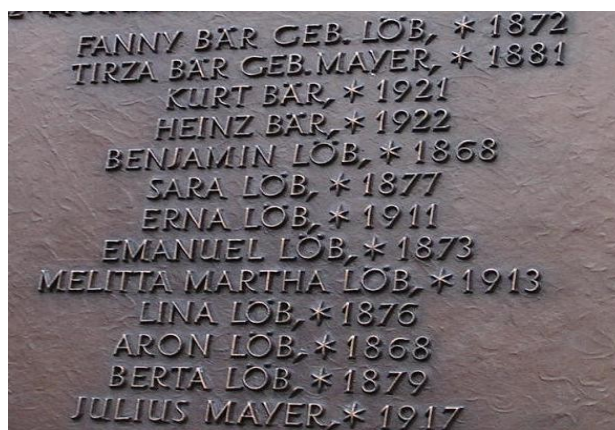
Plaque commémorative près de l'ancienne mairie à Birkenau