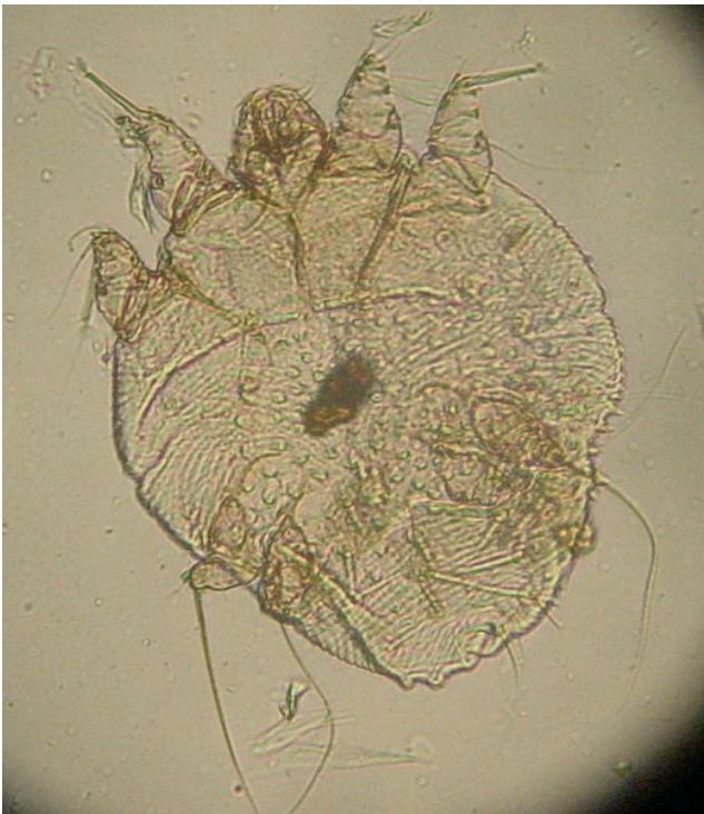
Sarcoptes scabiei