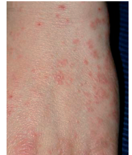
Exemple sur la main d'un patient atteint de gale