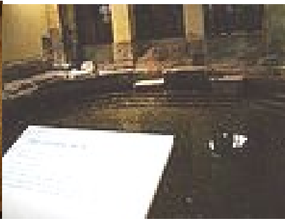
Un Frigidarium (bain froid)