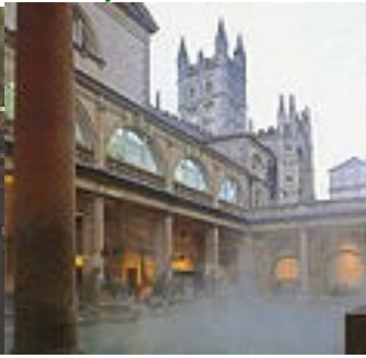
Un caldarium (bain chaud)

http://en.wikipedia.org/wiki/Roman_Baths_(Bath)