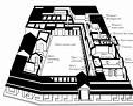
Une des sources Un tepidarium (bain tiède) Le plan de Roman Baths