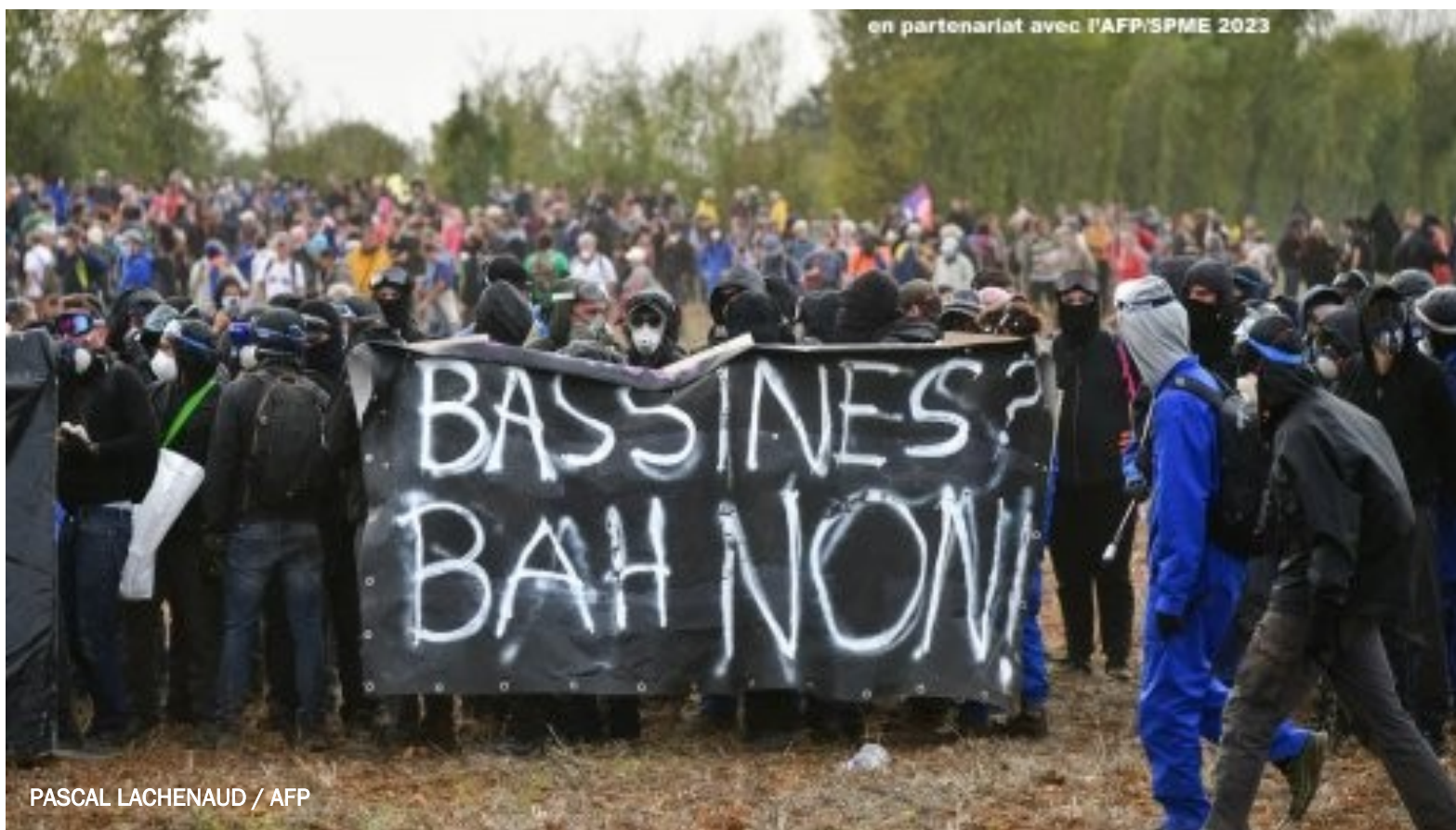
en partenariat avec l'AFP/SPME 2023