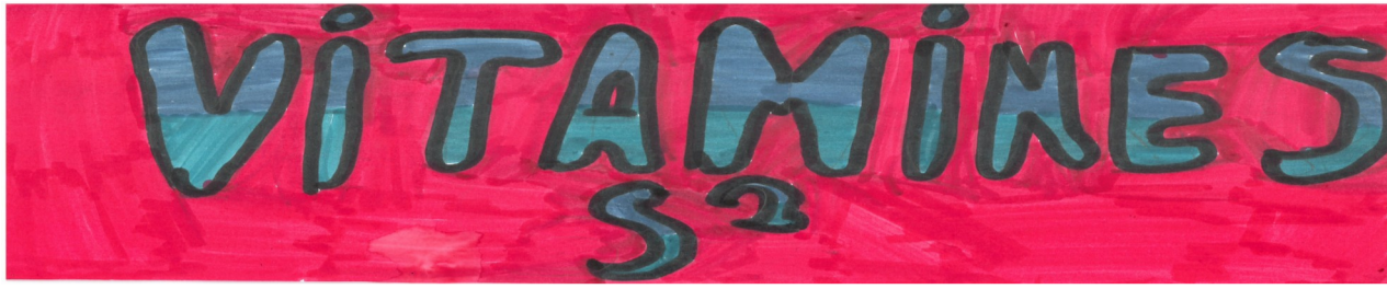
Dessin : Miia

Si la Suisse interdisait la consommation de cannabis au début des années 2000, celle-ci s'est montrée plus tolérante envers son usage dans les années qui ont suivies. Elle tend désormais vers la dépénalisation du cannabis récréatif et compte en proposer au sein des pharmacies de Bâle. Un habitant Bâlois souligne qu'il sera plus rassurant d'en acheter auprès des professionnels de la santé qu'auprès de gens peu recommandables.