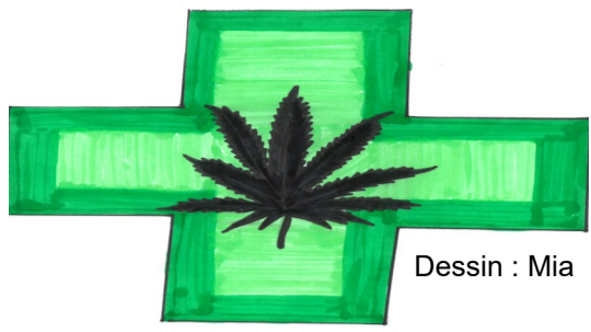
Dessin : Mia