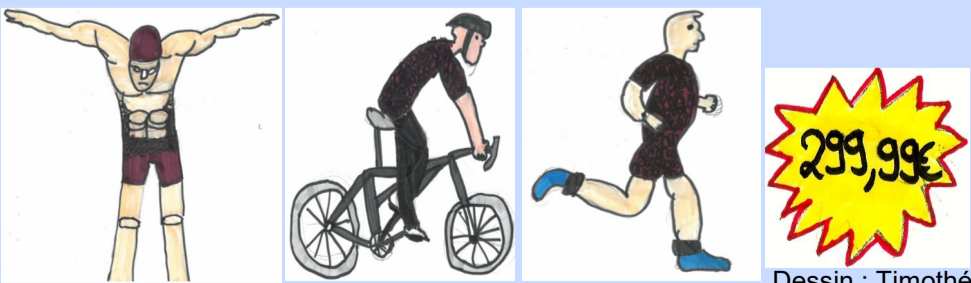
Dessin : Timothé

Voulez-vous aller plus vite? Achetez cette tenue. Elle se change en un rien de temps, vous deviendrez épatants.