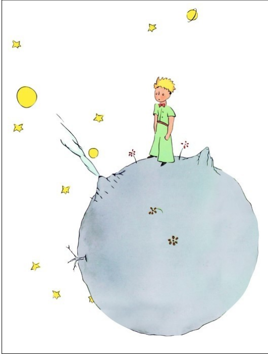
Dessin extrait du livre « Le Petit Prince » d'Antoine de Saint-Exupéry

Des dessins de presse qui sensibilisent par le sourire aux grands problèmes de société, vous connaissez ?