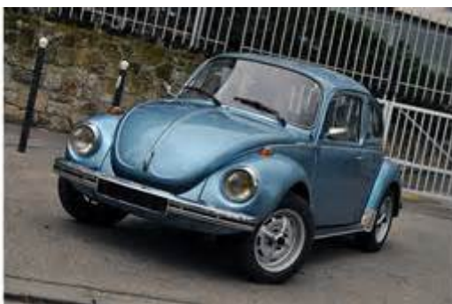
Photo de l'ancienne coccinelle

Avant de désigner une société automobile, le mot Volkswagen ( la voiture du peuple ) désigne le modèle de véhicule qui allait faire le succès de l'entreprise : la coccinelle