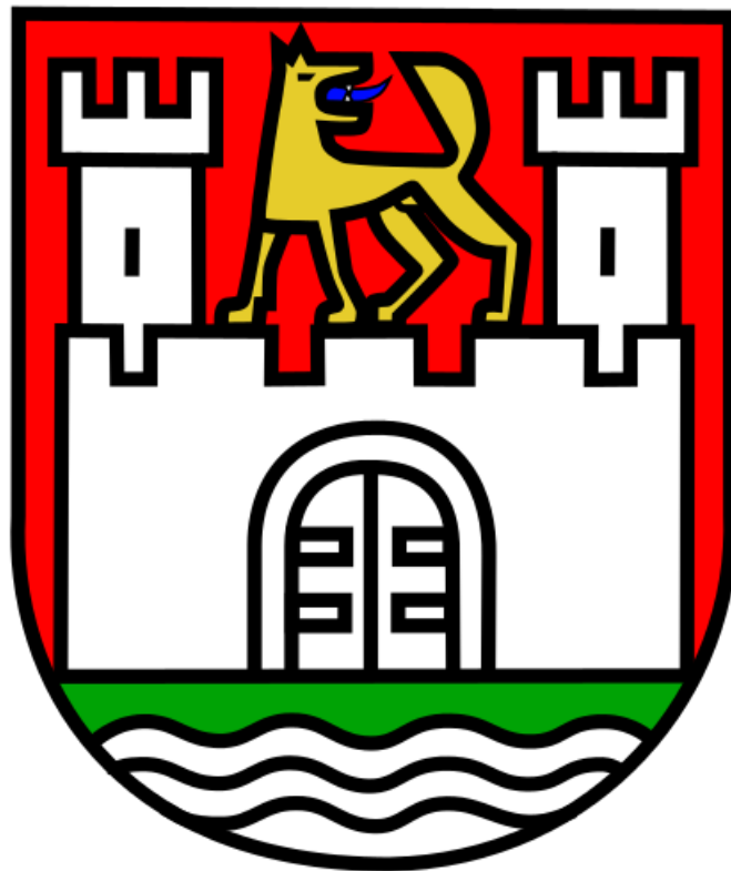
Blason de Wolfsburg