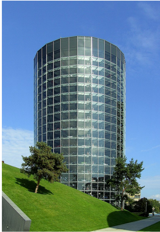
Bâtiment où les acheteurs viennent récupérer leurs voitures