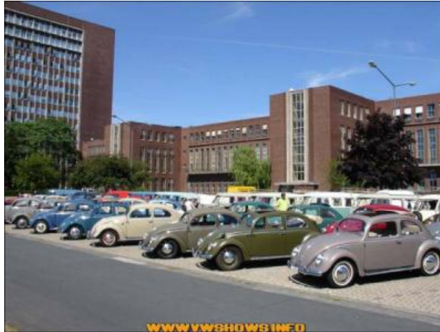
Photo d'ancien modèle développé par la marque