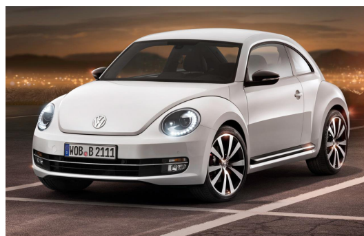
photo de la nouvelle coccinelle