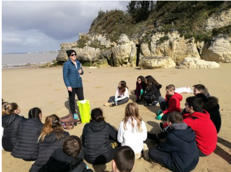
Le bac marée