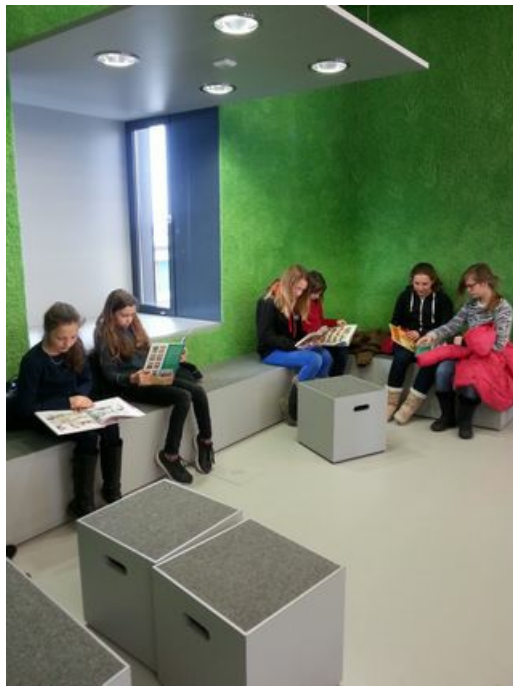
Accueil du maire :