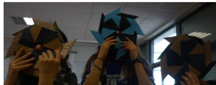
Atelier SHURIKEN (étoile ninja)