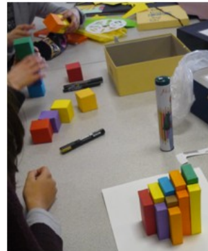
Ateliers "pavés" et "cubes"