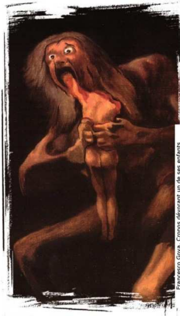
Francisco Goya, Cronos dévorant un de ses enfants