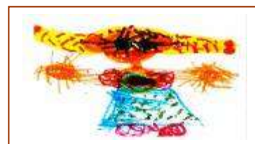
Les dessins sont de ma petite sœur.

Association regroupant les parents d'enfants autistes dans notre département. Le siège social se trouve à la Maison des Associations 31, rue du Cormier 17100 Saintes.