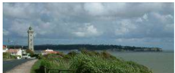
Photographie de J. Justamon (2005).