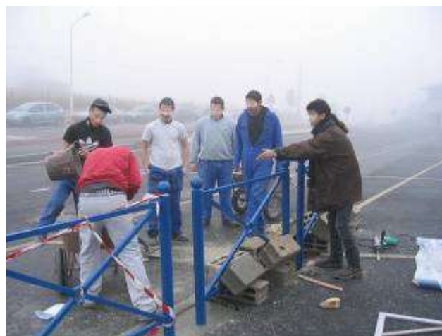
↑ Les élèves de 3 ème de la SEGPA contribuent à sécuriser le collège tout en apprenant leur métier.