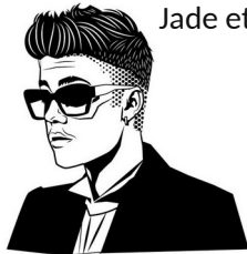
Illustration Free Vector Portal