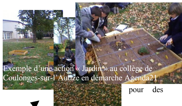
Exemple d'une action « Jardin » au collège de Coulonges-sur-l'Autize en démarche Agenda21