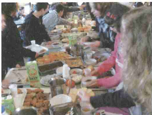
Organisation d'un petit-déjeuner pour les 6ème

Elle assure des entretiens individuels, la prévention par les visites médicales des élèves de 6e, organise le programme de prévention par des actions sur le thème de la santé.