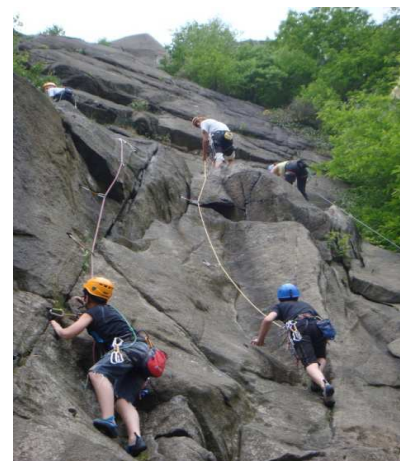
Stage en Ariège 2012