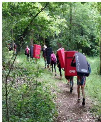
Sortie en bloc naturel en juin 2016