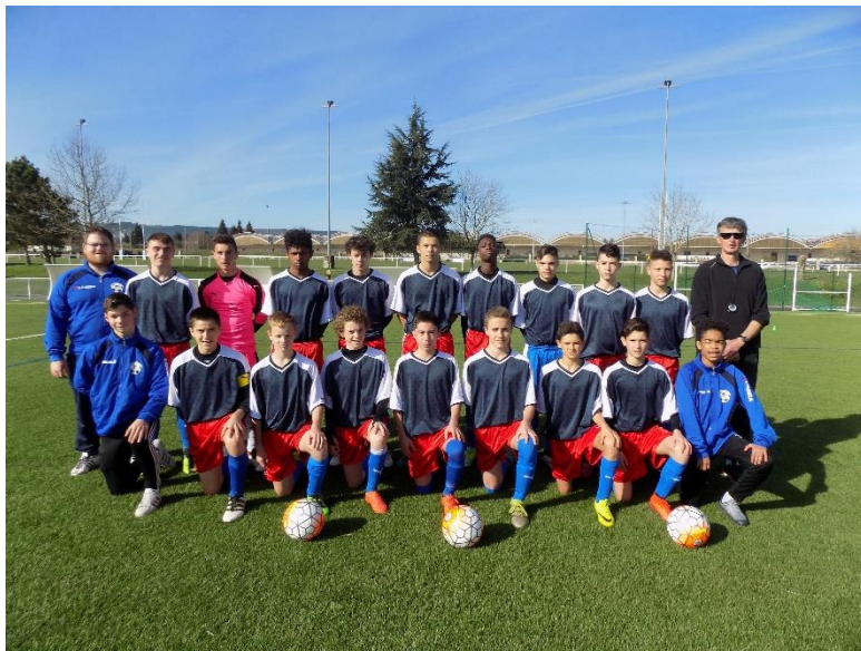
Foot : champions d'académie 2019