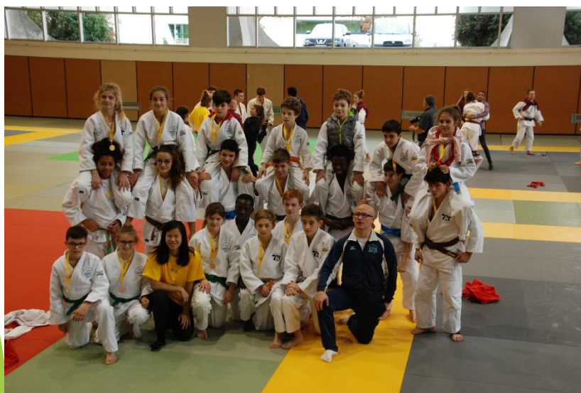
Filles Judo : 4 ème CF UNSS 2018 Garçons : 2 ème académie 2019