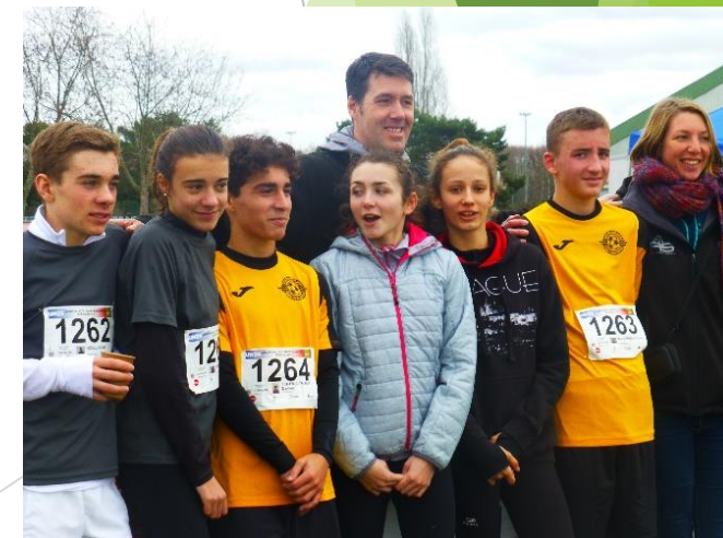
Cross : Championnat de France 2019