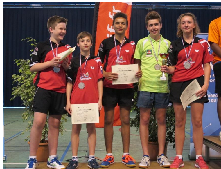
Vice champions de France UNSS 2018