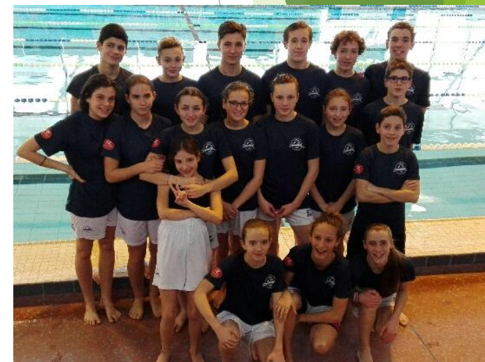
Natation : équipe 1 vice championne d'académie 2019