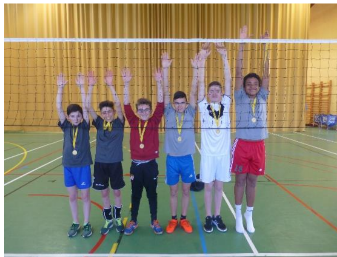
Volley ball : champions inter académie 2017 5 ème au championnat de France