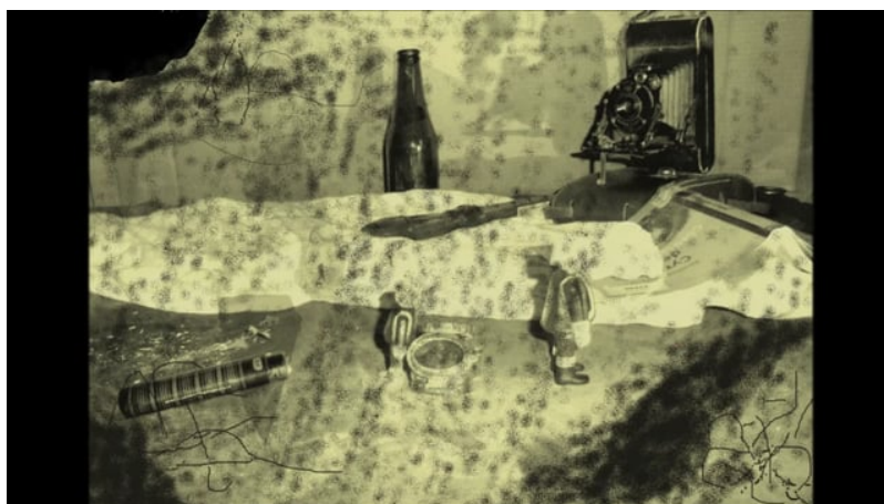
vanités 4B (Video Vimeo)