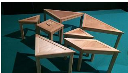
Expo maths et puzzles à Poitiers

Une autre façon de faire des maths sans s'en apercevoir, une expérience à renouveler !