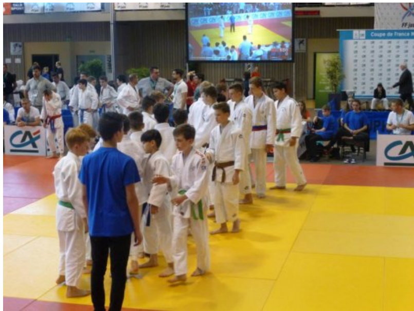
3eme jour dimanche 22 mai :

Le matin nous nous sommes réveillés vers 6h, les garçons étant éliminés de la compétition ont nettoyé les mobile-homes afin de les rendre à 10h00 tandis que les autres sont repartis pour la compétition.