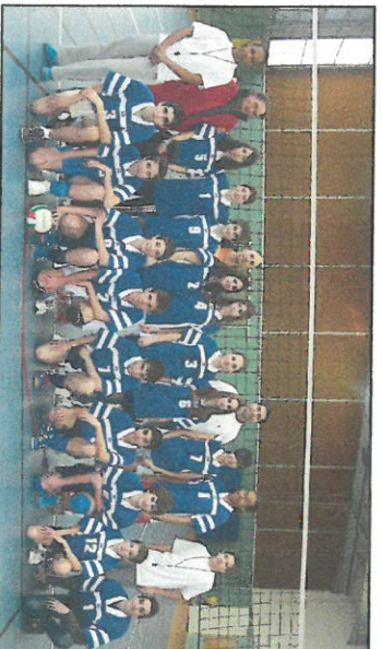
La section Sportive—année 2007 / 2008

Une suite est possible au lycée Bellevue depuis la rentrée 2015.