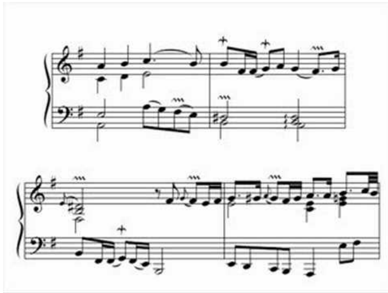
Sainte-Colombe: Les Pleurs - Savall, Coin (Video Youtube)