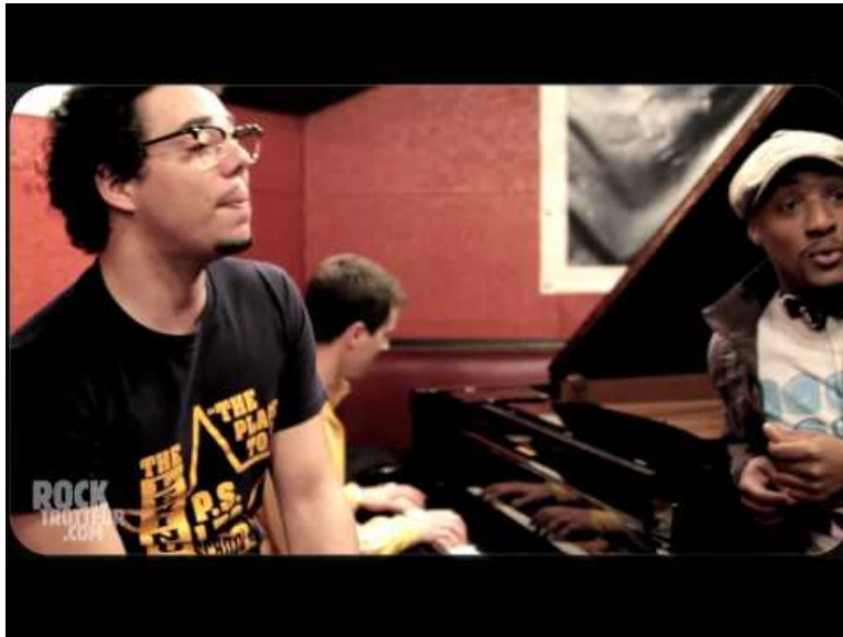
BEN L'ONCLE SOUL - SOUL MAN // Session acoustique - Blog.rocktrotteur.com (Video Youtube)