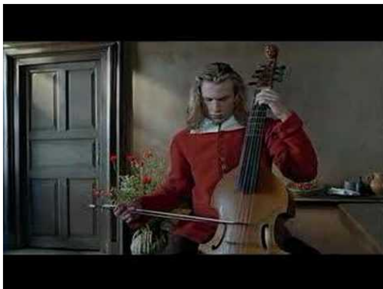
Tous Les Matins du Monde - Improvisation sur les Folies (Video Youtube)