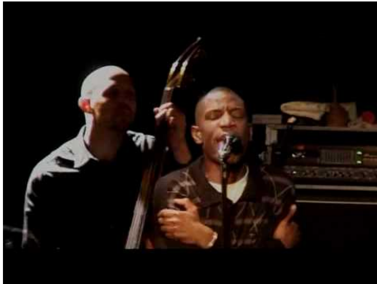
ABD AL MALIK - Gibraltar (Video Youtube)