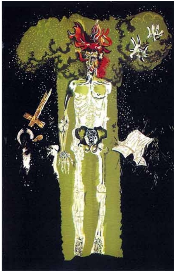
L'homme d'Hiroshima , 1957 4,30 x 2,92 m - Atelier Tabard, Aubusson