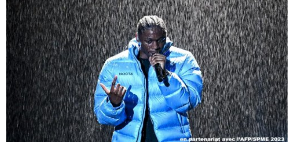
En partenariat avec l'AFP/SPME 2023

Le public peut voter jusqu'au 10 avril pour désigner 3 finalistes dans chacune des 13 catégories (sur 21) qui lui sont ouvertes. P.5