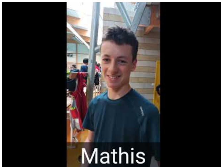
jmace (Video Youtube)