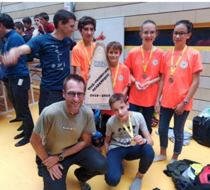
Qualifiés aux France UNSS raid de juin 2020 à Reims. (16/10/2019)