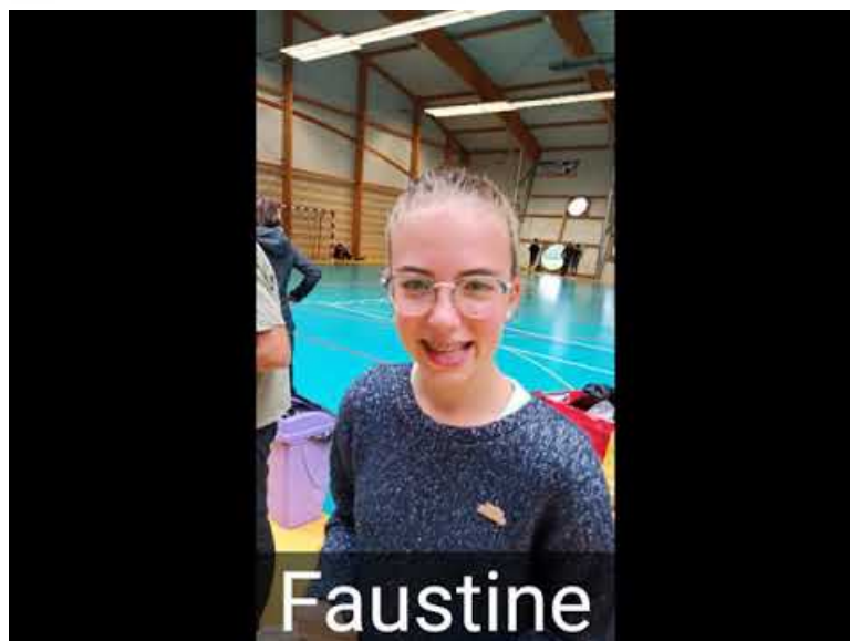
attente resultats (Video Youtube)