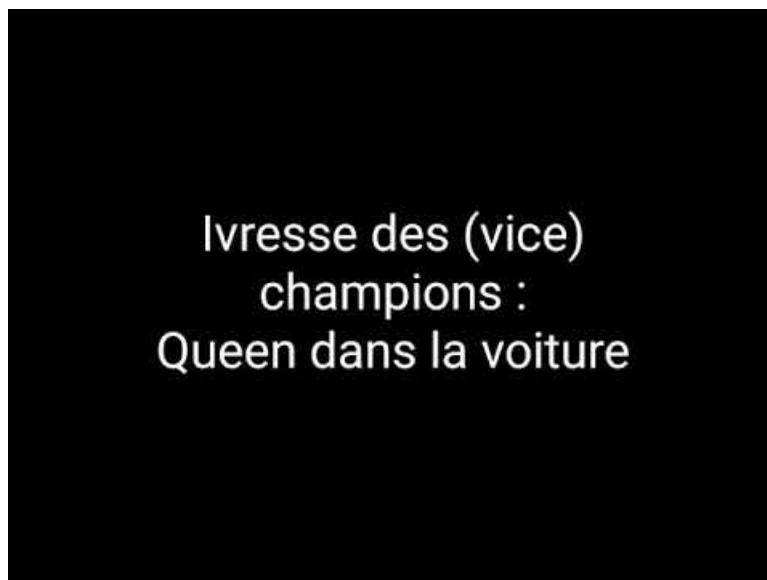
queen (Video Youtube)

Attention aux oreilles ! (trajet voiture retour après 2 jours de raid, on décompresse)