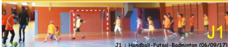
J1 : Handball-Futsal-Badminton (06/09/17)