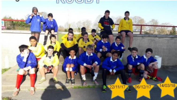
Vice-champions académique RUGBY 2016-2017