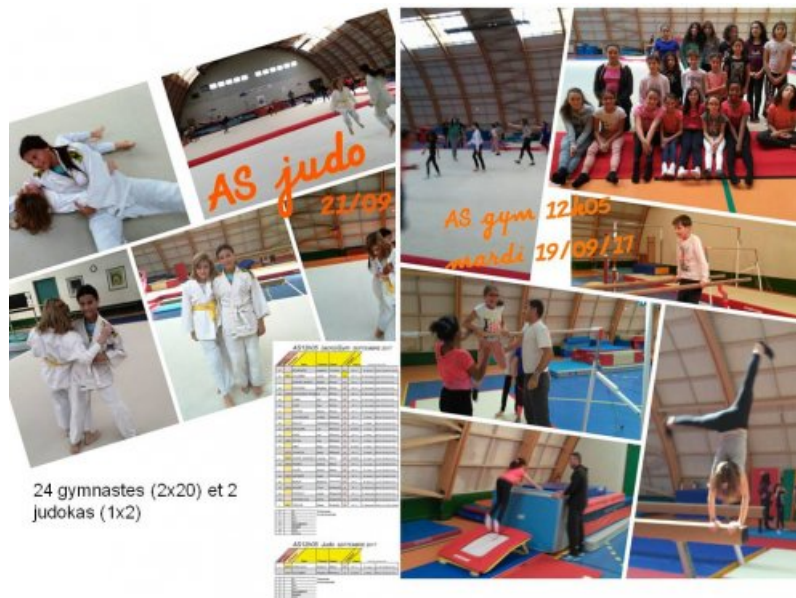
24 gymnastes (2x20) et 2 judokas (1x2)