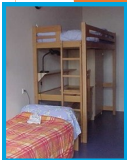
L'internat et le foyer