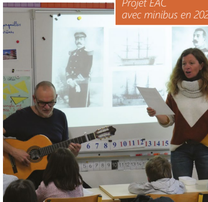
Projet EAC avec minibus en 2023