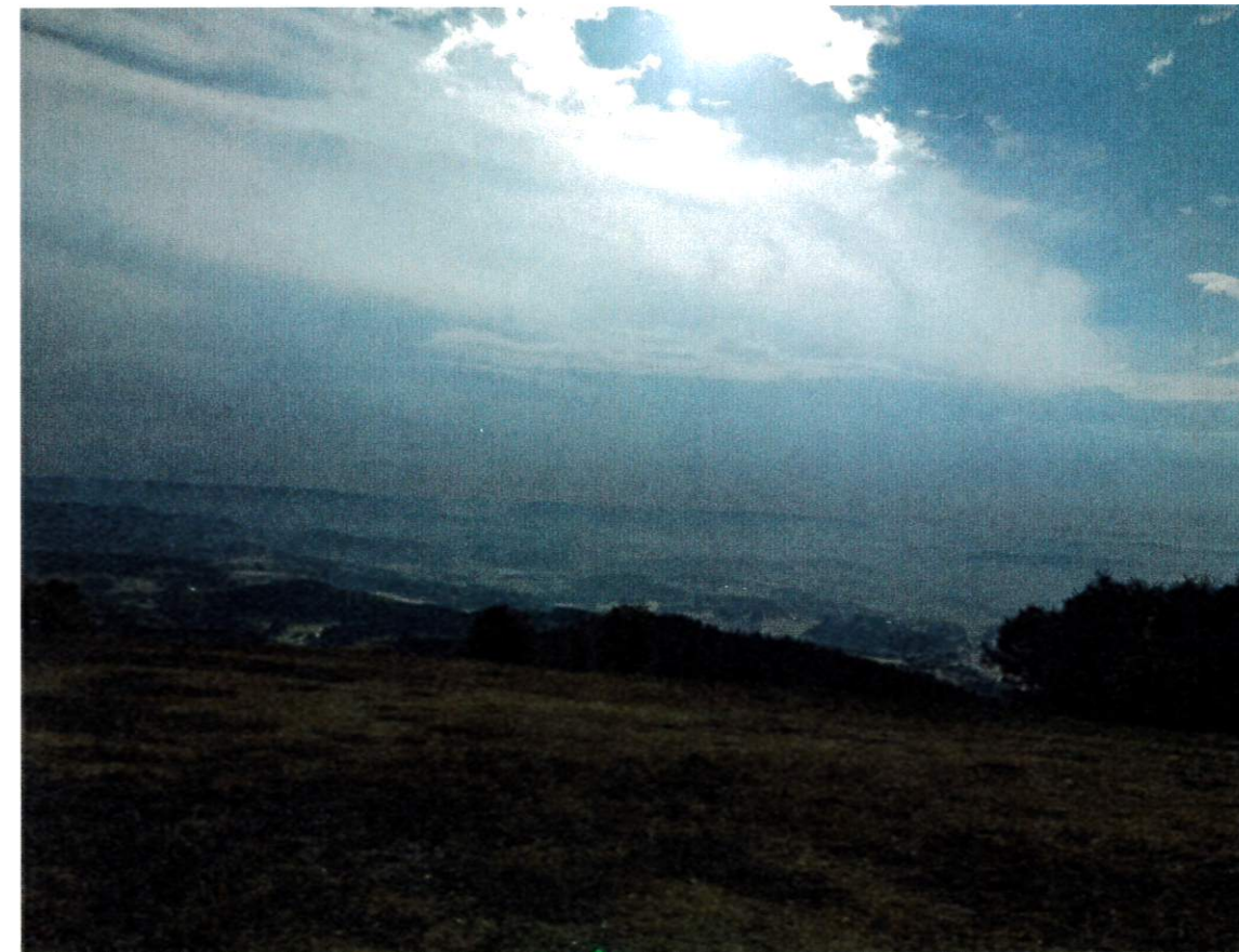
La vue de Bibracte sur la montagne