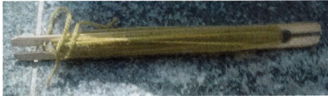
Une navette qui a du fil autour

A Bibracte il y a une grande forêt qui s'appelle le Mont Beuvray où beaucoup de randonneurs se promènent pour voir les beaux paysages. Il y a beaucoup de pentes car nous sommes en montagne. Il y a une fontaine ou un peu plus loin se trouve une maison avec 36 pièces. Il faut marcher un petit kilomètre pour pouvoir apercevoir des remparts. Nous avons vu une cave de maison gauloise où sur la porte il y avait marqué « XV ». Il y avait un joli panorama. Les voies gauloises faisaient 13 mètres de large. L'après midi nous avons tisser de la laine.