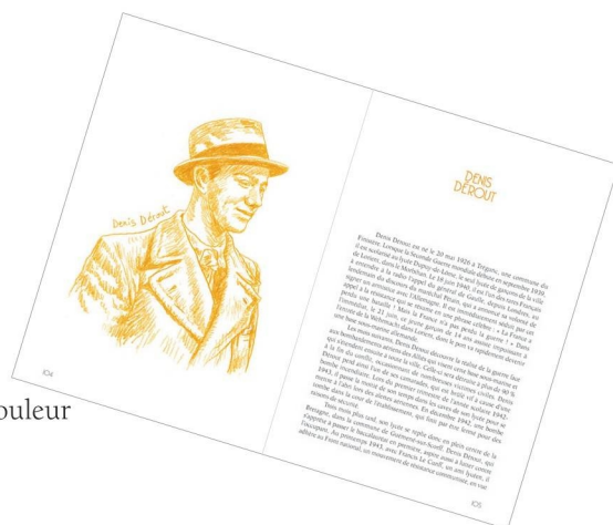
Illustration Éric Herpin

16 x 24 cm 400 pages 123 dessins au crayon de couleur 31 photographies 10,62 € ISBN : 978-2-9564580-1-2