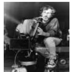
S.Spielberg / Réalisateur