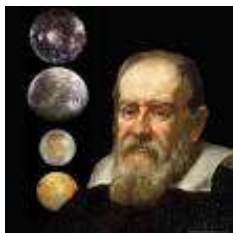
Galilée / Astronome