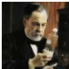
L.Pasteur / Scientifique