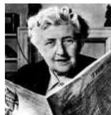
A.Christie / Écrivain