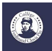
Devant côté cœur